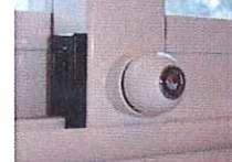
Assur'Baie standard avec axe de 12 mm